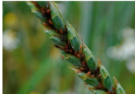
Donker gekleurde grote graanluizen in de aar

De roos-grasluis is 2,3-3 mm lang en is lichtgroen met lichtgekleurde poten, soms met een donkere streep over de rug. De sprieten zijn bijna even lang als het lichaam. Sprieten en poten zijn licht van kleur. Deze bladluis komt vrijwel alleen voor op de bladeren en de stengels. De overwintering gebeurt als eistadium op rozen.