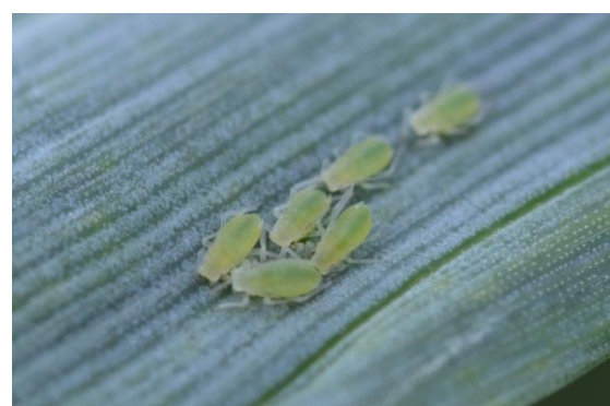
Roos-grasluizen op het blad