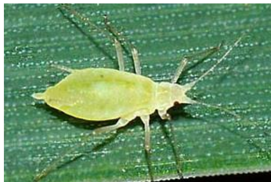
Lichtgroene roos-grasluis met lange lichtgroene sprieten en poten

De roos-grasluis is 2,3-3 mm lang en is lichtgroen met lichtgekleurde poten, soms met een donkere streep over de rug. De sprieten zijn bijna even lang als het lichaam. Sprieten en poten zijn licht van kleur. Deze bladluis komt vrijwel alleen voor op de bladeren en de stengels. De overwintering gebeurt als eistadium op rozen.