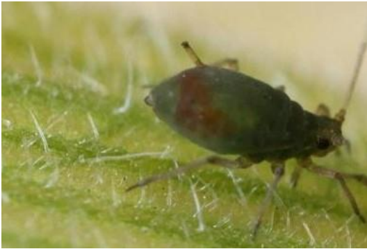
Vogelkersluis met roodachtige vlek op het achterlijf

De vogelkersluis is 1,2-2,4 mm lang. De kleur van deze vrij sterk glanzende bladluis is olijfgroen tot bruinachtig, heeft donkere poten en een rode vlek op het achterlijf. Het lichaam is licht bedekt met een wasachtig poeder. De sprieten zijn korter dan het lichaam. De vogelkersluis zit vooral op de stengels en overwintert op vogelkers.