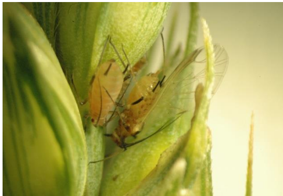
Grote graanluizen met donkere poten

De grote graanluis is 2-3 mm lang. De kleur is variabel, van geelgroen tot roodbruin, soms zwart, met donkerbruine tot zwarte poten. De sprieten en poten zijn vrij lang, donkerbruin tot zwart. De bladluis komt vooral voor op de bladeren bij het in aar komen van de tarwe, maar verhuist dan snel naar de aren. De bladluis overwintert als winterei op granen en grassen.