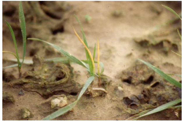
Figuur 2. Jongste blad sterft af (De Proft, 2017)