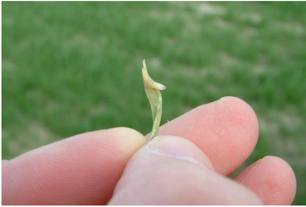
Figuur 1. Larven van de smalle graanvlieg in de stengel (De Proft, 2017)