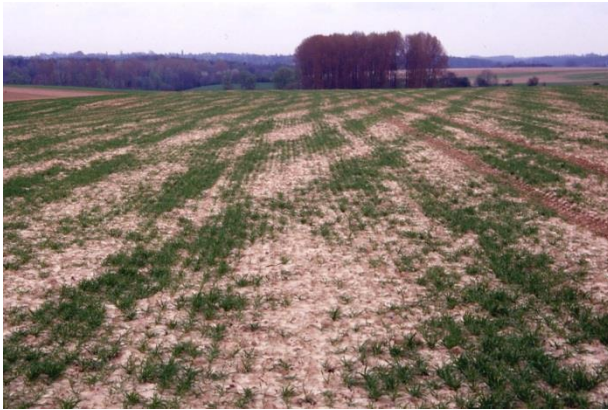
Figuur 3. Schade aangericht door de smalle graanvlieg (De Proft, 2017)