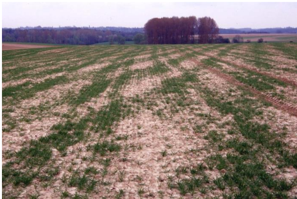
Schade aangericht door de smalle graanvlieg